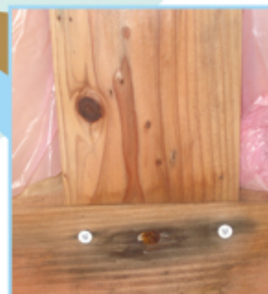
壁体内の木材の蒸れ腐れ