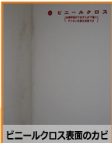
ビニールクロス表面のカビ